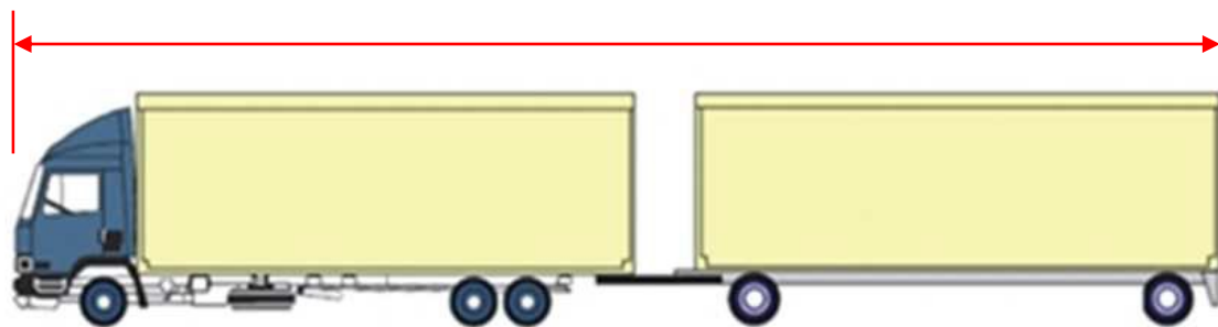
フルトレーラ連結車（バン型）25mまで